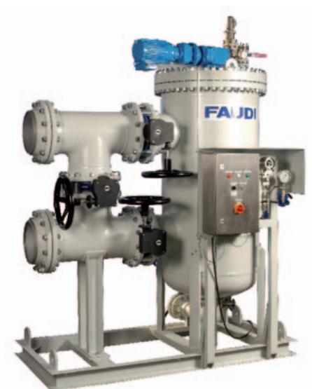
Фильтр с обратной промывкой RSF 30

Непосредственное использование морской воды в качестве технической или охлаждающей воды на промышленных предприятиях, размещенных на берегу и в море, как правило, связано с серьезными проблемами загрязнения. В сильной зависимости от региона нефилترованная морская вода может содержать в себе составляющие, такие как микроорганизмы, небольшие водные организмы, двустворчатые моллюски, а также взвешенные твердые частицы, которые имеют разрушающее воздействие на компоненты системы ниже по потоку. С целью улучшения качества и предотвращения негативных эффектов в отношении передачи тепла, материалов и работы предприятия морскую воду необходимо фильтровать. В частности, в теплопередающих компонентах системы, например, теплообменниках, образование осадка (загрязнения) приводит к значительным дополнительным расходам в связи с вредом, вызванным коррозией, и ухудшением скорости теплопередачи компонентов системы. Увеличение энергозатрат в связи с падением давления в системе, а также масштабные работы по очистке и техническому обслуживанию приводят к увеличению ССО (совокупной стоимости оборудования). Также увеличиваются инвестиционные затраты на компоненты системы, такие как насосы и теплообменники, поскольку без очистки, их необходимо планировать в более крупных размерах.